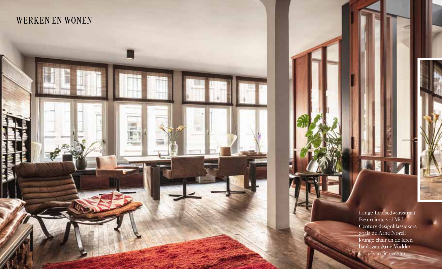
Lange Leidsedwardsstraat: Een ruimte vol Mid Century designklassiekers, zoals de Arne Norell lounge chair en de leren bank van Arne Vodder voor Ivan Schlechter.