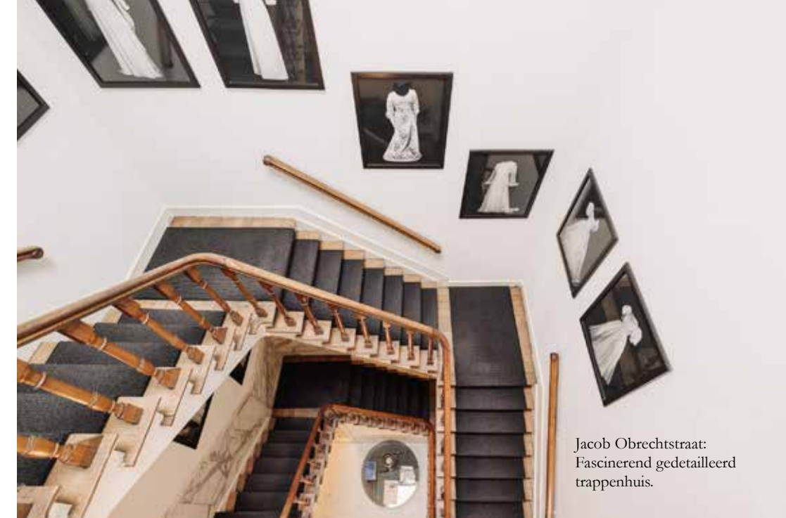
Jacob Obrechtstraat: Fascinerend gedetailleerd trappenhuis.