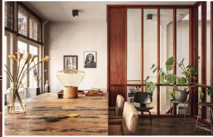
Lange Leidsedwardsstraat: Het gebruik van natuurlijke materialen, waaronder veel hout, geven een warme touch aan het verder industriële pand.