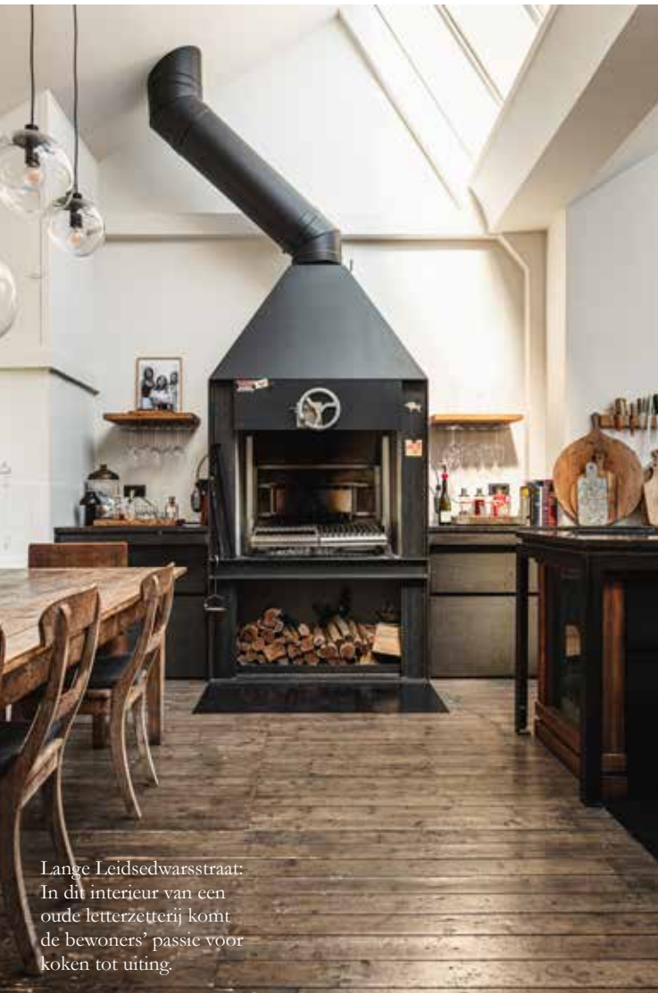
Lange Leidsedwardsstraat: In dit interieur van een oude letterzetterij komt de bewoners' passie voor koken tot uiting.